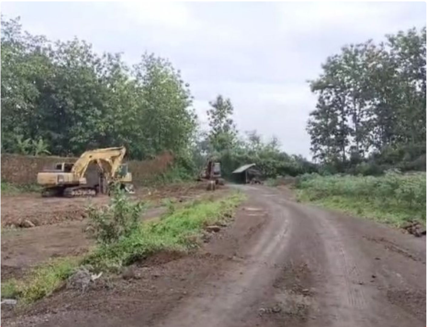
Foto: Tambang galian C di Desa Sumbermulyo, Kecamatan Tlogowungu, Kabupaten Pati, Jawa Tengah.

PATI - Cabang Dinas ESDM Wilayah Kendeng Muria kembali menjadi sorotan. Tambang galian C di Desa Sumbermulyo, Kecamatan Tlogowungu, diduga